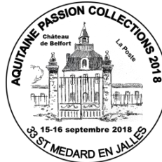
TAD « Exposition philatélique »