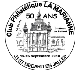
TAD « 50 ans du club »