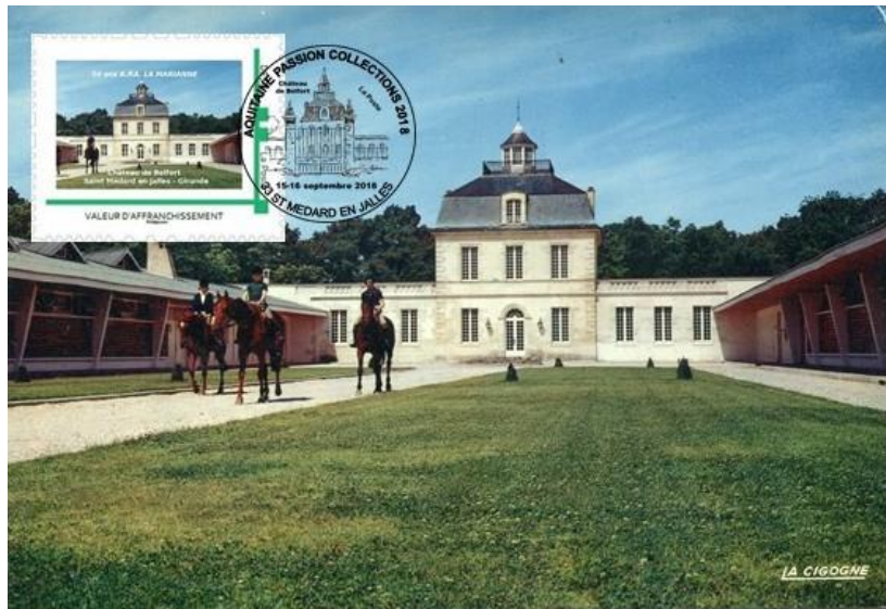
Carte postale couleur (n°1) avec timbre à date illustré « exposition philatélique »